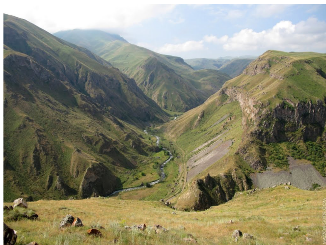
Widok z płaskowyżu Tsar