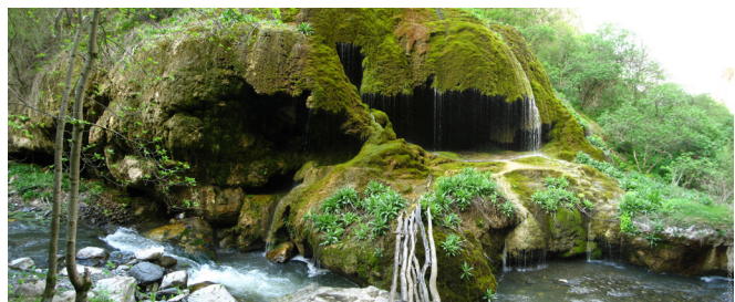
Wąwóz rzeki Karkar - wodospady