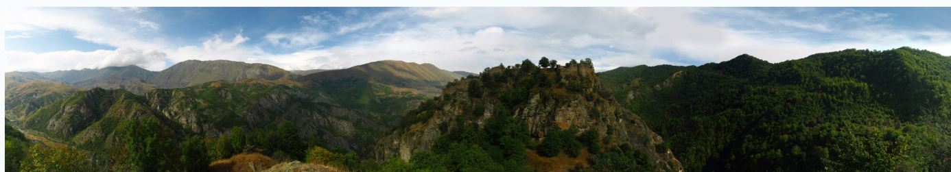
Panorama twierdzy Handaberd