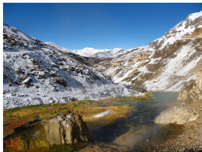
Widok na opuszczony sowiecki ośrodek Istisu