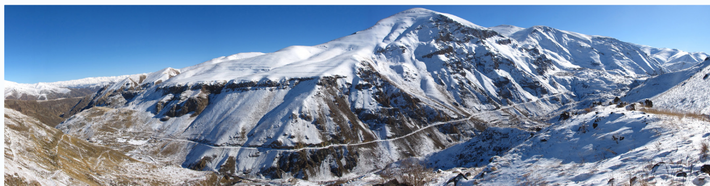
Wąwóz rzeki Tartar