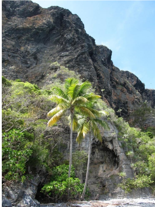
Fot. 1 Fragment klifu skalnego na Playa Fronton

asekuracji. Pod ścianę nie prowadzi żadna droga. Można dotrzeć tutaj tylko ścieżką przez dżunglę lub łodzią motorową wynajętą w Las Galeras.